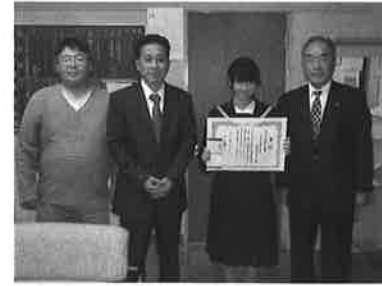
写真上、左から青陵中学校、吉田方中学校、御津中学校での表彰式