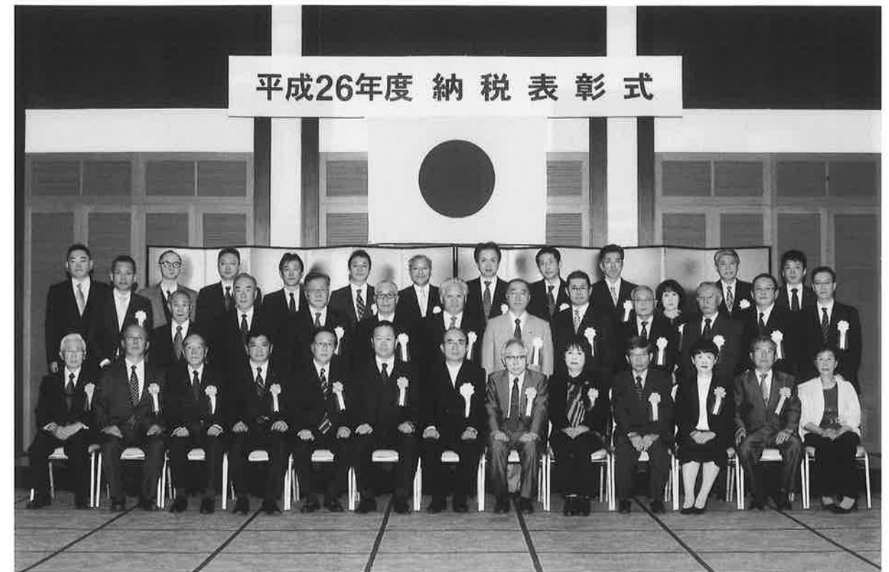
写真：前列左から 1 番目