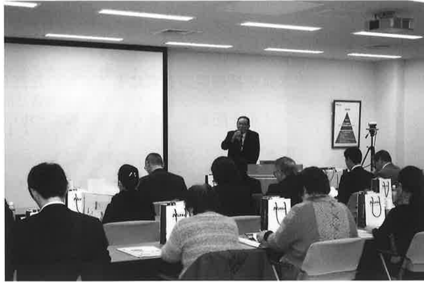
(写真上：研修風景 講師：筆頭副署長 大橋慎一様)

東三河間税会、税務研修会・企業見学を平成 27 年 2 月 19 日 (木) に日東電工株式会社 豊橋事業所で開催いたしました。会員ら 20 名が見守る中、社員の方から同社のインフォメーションをいただいた後、新設されたイノベーションセンターを見学しました。同事業所はテープ事業を担う基幹事業所であり、粘着テープ研究開発の拠点でもあります。現在ではテープの研究が進み、車両に、テレビ画面の中に使用されたり、住宅においては冷暖房効率をよくする場面に使用されたりと、活躍の場がたくさんあることを体験させていただきました。