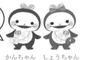
かんちゃん しょうちゃん